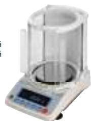
Большой противосквозняковый бокс FXi-11

*при использовании с DX-WP, DL-WP не соответствует классу защиты IP65