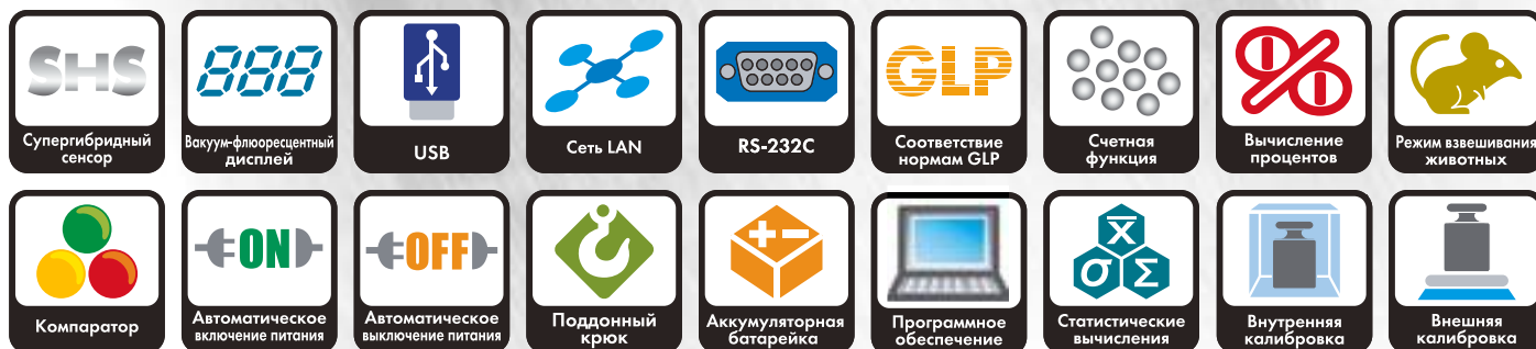
(DX, DX-WP) (DL, DL-WP)

Новое достижение японских инженеров – серии DX-WP и DL-WP, которые позволяют взвешивать жидкости и порошки с разрешением 1 мг. При этом весы полностью защищены от проникновения воды и пыли внутрь прибора, что значительно расширяет их область использования.